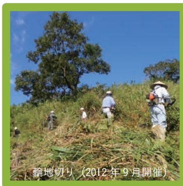
輪地切り（2012年9月開催）