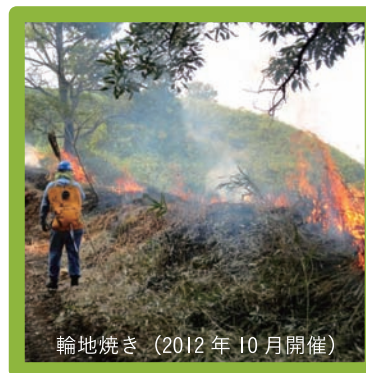
輪地焼き（2012年10月開催）